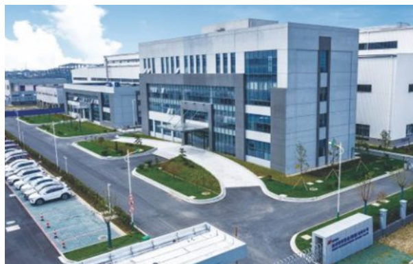
纽威精密锻造(溧阳) 主要产品:自由锻/环形锻/砂铸件 办公面积:3,000平方米 车间:30,000平方米