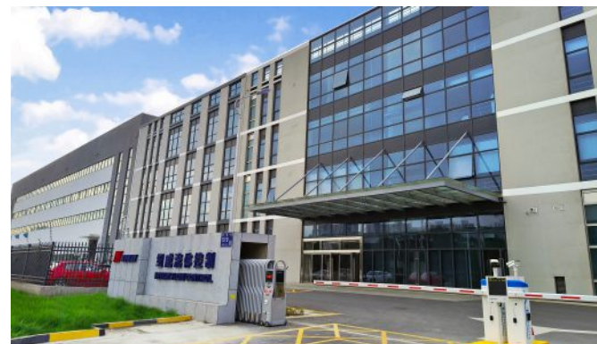
纽威流体控制(苏州) 主要产品:高性能蝶阀、锻钢阀 占地面积:30,000平方米 车间:19,000平方米(一层) 7,000平方米(二层)