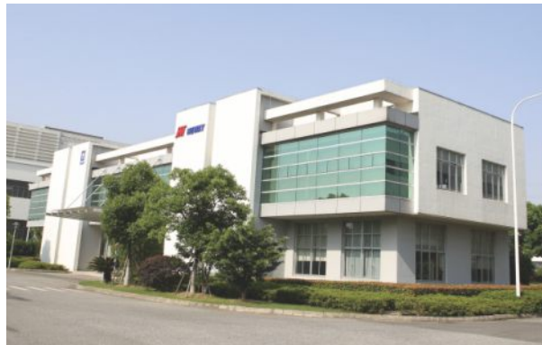
纽威铸造(苏州) 主要产品:砂铸造 占地面积:112,500平方米 车间:98,000平方米