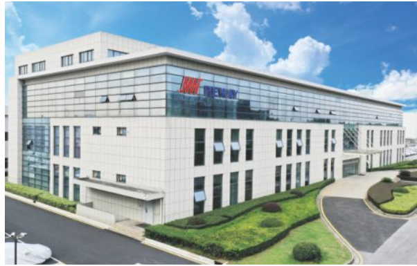
纽威总部 建筑面积:2,295平方米