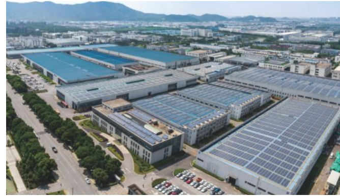
纽威生产基地 主要产品:球阀, 闸阀, 截止阀, 止回阀, 锻钢阀门, 蝶阀 占地面积:230,000平方米 车间:140,061平方米