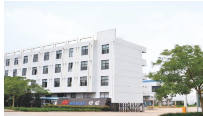
纽威铸造(大丰) 主要产品:精铸件 占地面积:40,000平方米 车间:20,000平方米